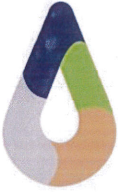
สัญลักษณ์รูปหยดน้ำ

อถล. เป็นการรวมกลุ่มของประชาชนในท้องถิ่นที่มีจิตอาสาในการช่วยเหลืองานขององค์กรปกครองส่วนท้องถิ่น เกี่ยวกับการจัดการสิ่งปฏิกูลและมูลฝอย การปกป้องและรักษาทรัพยากรธรรมชาติและสิ่งแวดล้อม