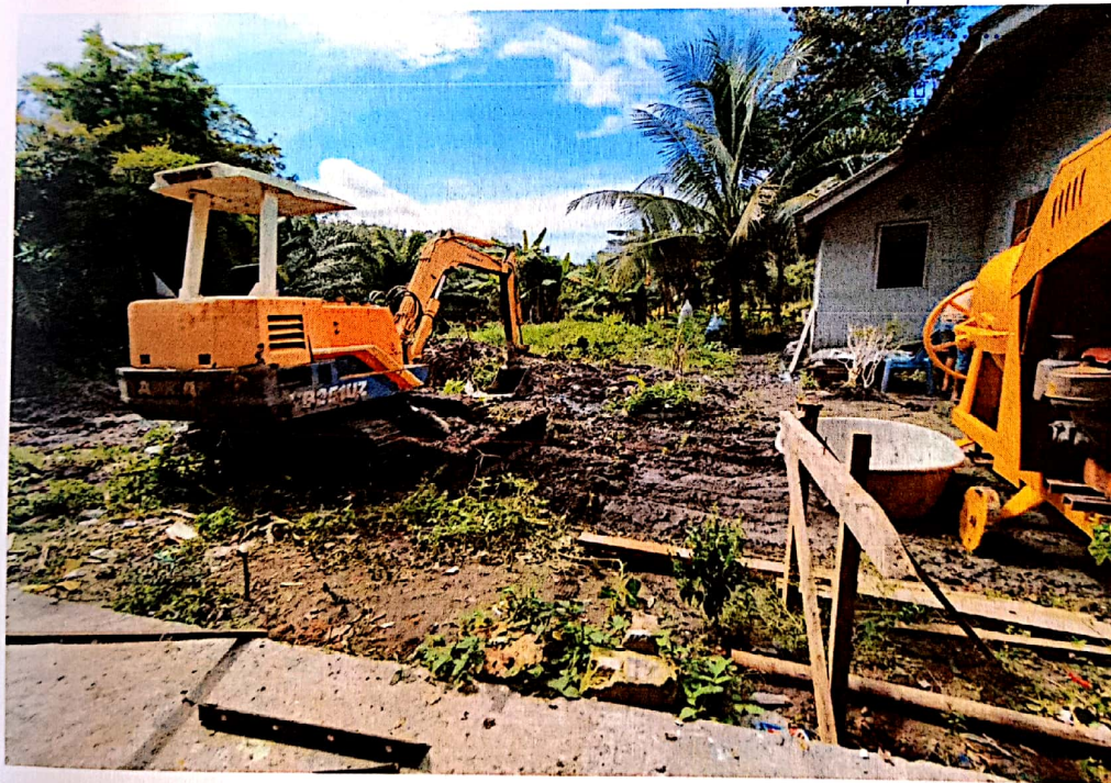
ปรับพื้นที่และขุดหลุมฐานราก

.....ประธานกรรมการ (ลงชื่อ).....กรรมการ (ลงชื่อ).....กรรมการ .....กรรมการ .....กรรมการ