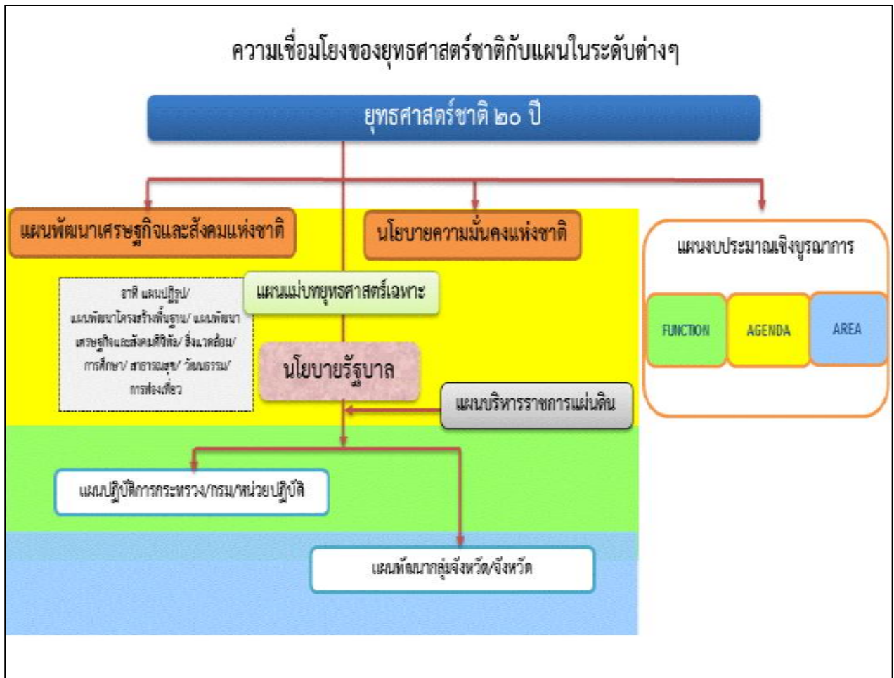
ความเชื่อมโยงของยุทธศาสตร์ชาติกับแผนในระดับต่าง ๆ